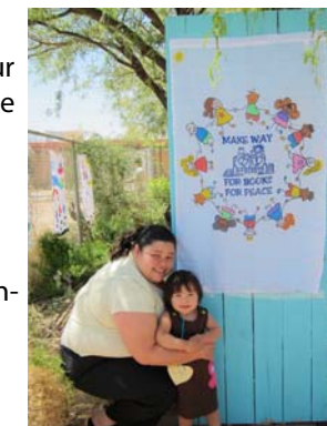
Parent and child involved in the Peace Project

carefully chosen picture books and extension activities focused on different areas of peace. The project features wonderful stories of self-esteem, friendship, diversity, tolerance, generosity, caring, compassion, sharing, respect for all life, and positive conflict resolution. Children, teachers, and parents get to experience the tremendous power books have to inspire and guide young children. Sites also benefit from on-site literacy coaching and support from a MWFB early literacy consultant. This project helps ensure that caregivers have the skills and resources to establish a peaceful environment where all children are supported and successful in their development.