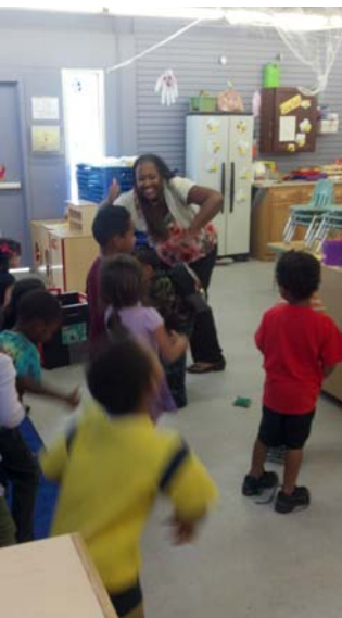
¡Los niños se divierten bailando la canción Tooty Ta!