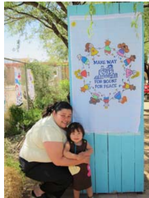
Padre de familia y niño involucrados en el Proyecto de Paz