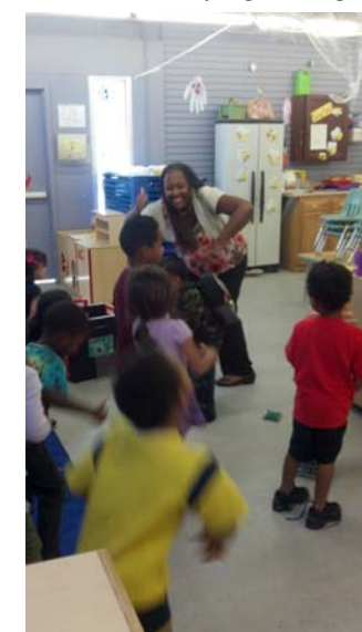
Children have fun dancing to the Tooty Ta song!

On this day, children were read the story Grumpy Bird from the Peace Starts with Me Collection which features books and activities that relate to self-concept, self-esteem, identifying feelings, and developing self-control. April began by asking the children if they ever feel grumpy. She had the children show what a grumpy face looks like and checkout their own faces in a mirror.